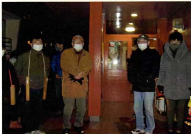
マスクとソーシャルディスタンスを 保って出発～!

令和2年12月28日～30日まで自治会 管理組合代表の方達と年末合同 防火・防犯パトロールを行いました。