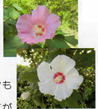
フヨウやムクゲの花も夏のハマロードを彩っていました。

元気な今は、介護になった時などの事を想像できませんが、出来るだけ介護保険を使って、我が家で過ごしたいと思いませんか。