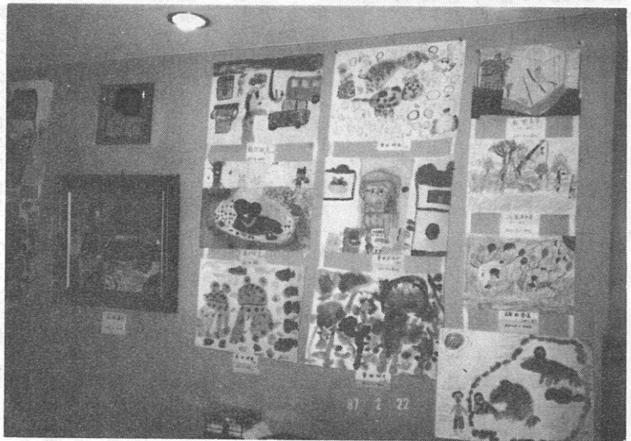
作品展に出品された力作の数々

二月二十一日、二十二日の両日恒例の作品展が催されました。二十二日は国際女子駅伝と重なり出足が鈍るのでは、と心配されましたが、それ程影響もなく、皆様の力作ばかりで、小さいお子さんの絵は創造性豊かな楽しい絵もあり、大人の方の絵は独創的であり、見知らぬ土地へ連れて行っ