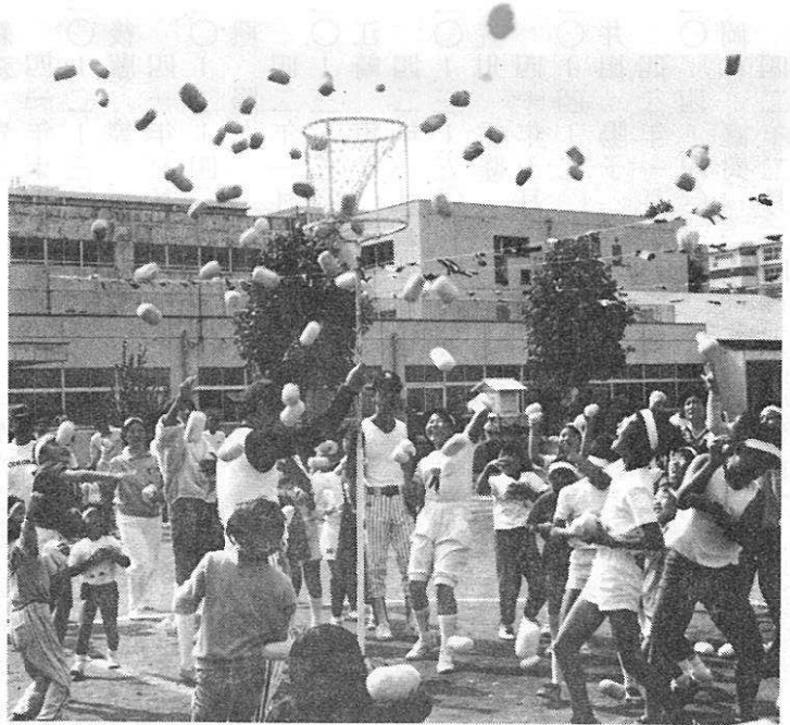
早くたくさん入って〜 玉入れ競技

年通り、黄色組でした。それにしても感じるのは人集めの大変さです。入居当時より子供の年齢が上がっており、参加する子供が少なくなっており、特に中学生以上になると極端に少なくなります。運動会の花であるチーム対抗リレーもこのままでは難しくなります。それに、色別もいつまでも同じ組み合わせではなく、そろそろ変えても良い時期ではないでしょうか。その方が、自治会員の親睦にもなります。来年は、十回目です。色々な意味で考える時期にきているような気がします。