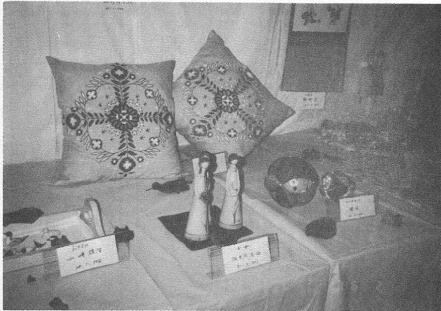
▲人形あり、パッチワークあり、 書画ありで多彩な作品展

二月八日、九日の二日間 にわたり、文化部で作品展 を開催しました。 八日は今年初めて雪が降 り、寒くて心配しましたが 日頃の趣味の成果を示すす ばらしい作品が多数集まり ました。