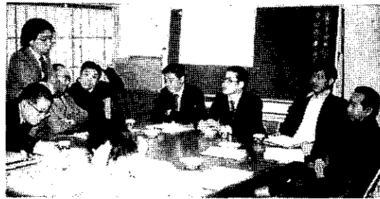
写真は集会所での話し合い風景